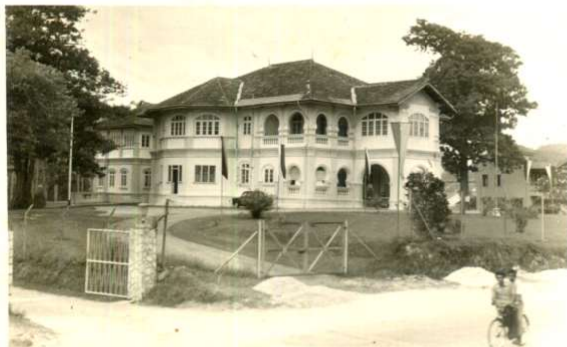
Ibu Pejabat Hal Ehwal Ugama Islam Dan Majlis Ugama Islam Selangor , terletak di-Bandar Di-Raja Klang.